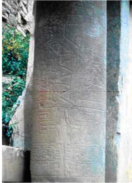
Figura 2. Representación de la vagina dentada en un lito cilíndrico de 3.5m de altura correspondiente al ala Sur de un templo tardío. (Malpartida, 2002).