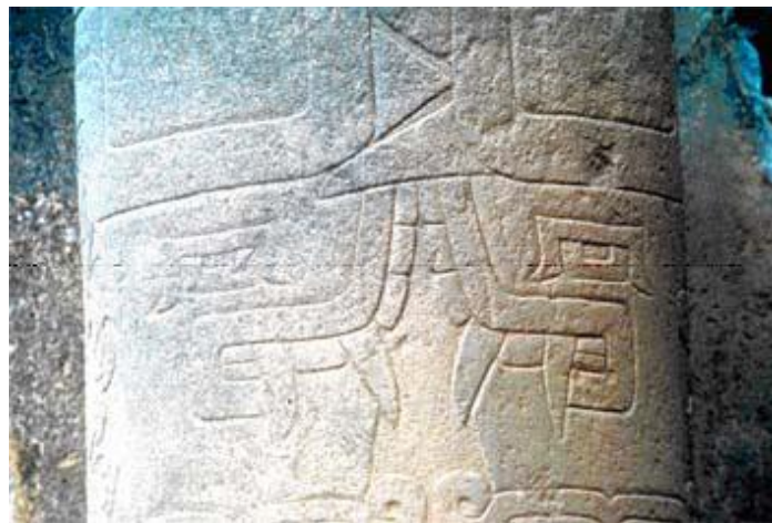
Figura 3. Inscripción aumentada tomada de la representación anterior.